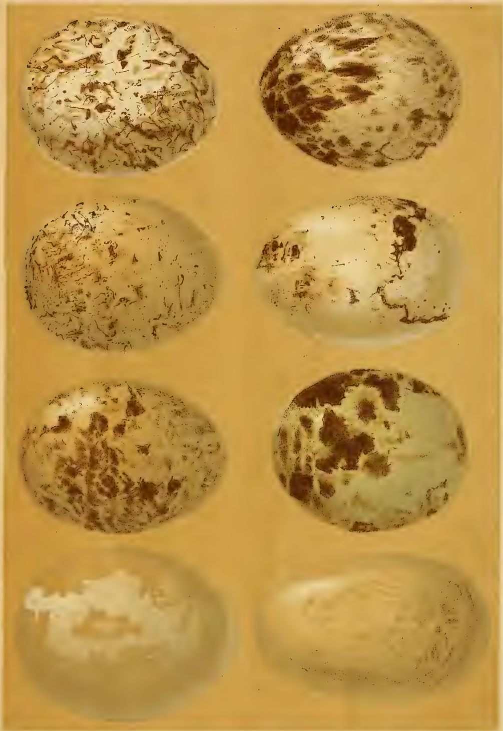
Eier von Milvus kochii